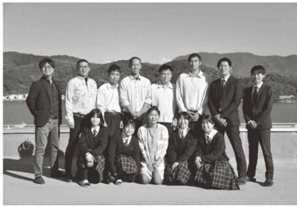
商品開発メンバーと龍神乃里スタッフ

本校は、平成18年に設置されて以来、栄えある歴史を誇る安下庄高校と久賀高校の伝統と教育機能を継承する周防大島唯一の高校で、現在、地域創生科（ビジネスコース、福祉コース）・普通科（特別進学コース、普通コース、環境コース）の2学科5コースを設置しています。今回は、そのうちの全国に一つしかない地域創生科の生徒達の取組について紹介します。