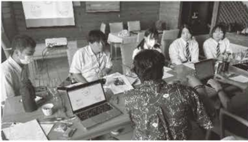
デザイナーさんとのデザイン会議

味が決定した後は、東京のデザイナーの方とデザイン会議を行いました。会議では、瀬戸内海の美しい海を表現するために、どのようなパッケージや商品名にしたらいいか話し合いを重ねました。様々な案が出ましたが、最終的な商品名を「瀬戸内のダイヤ」としました。パッケージについては生徒のイメージした通りにデザインを制作していただき、多くの案から一つに絞ることができました。